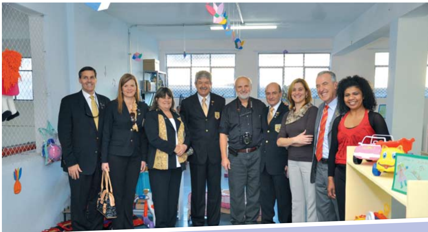
Imagem pública é foco na visita ao Diadema Floreart