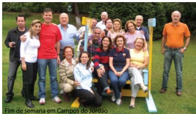
Fim de semana em Campos do Jordão

Com o apoio e o incentivo a Família Rotária, o Rotary estará contribuindo com a integração entre os povos e a paz mundial.