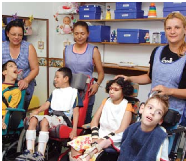
A participação em atividades auxilia no desenvolvimento das crianças