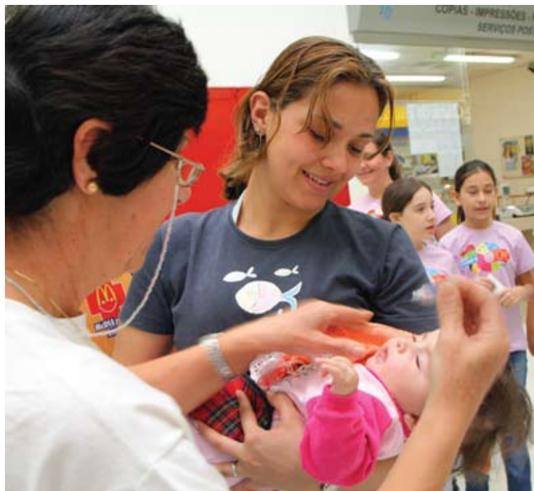
Atuação efetiva do Rotary no Programa Pólio Plus

Aparentemente diversificadas, há um elo comum entre estas atividades: a alegria de servir, a liderança contagiante dos que removem montanhas para atuar