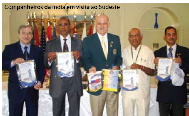
Companheiros da Índia em visita ao Sudeste