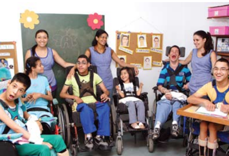
Alunos recebem alfabetização e acompanhamento personalizado