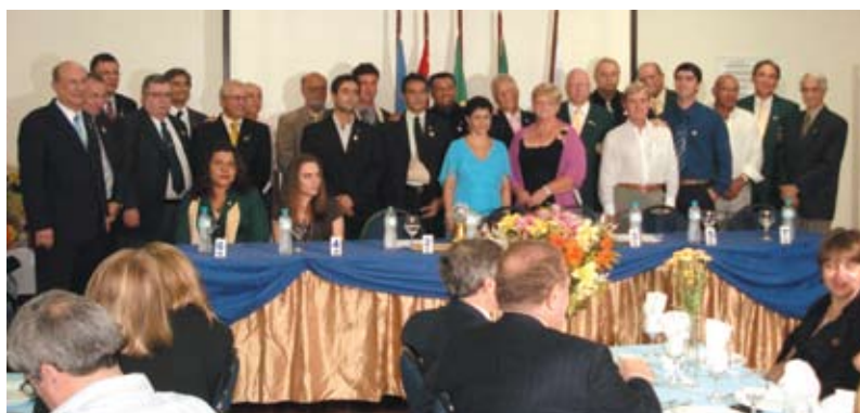
Sócios fundadores do RC de Bertioga Riviera de São Lourenço

A cerimônia foi coroada com a doação, pela família Ribeiro, de um terreno para a instalação de um projeto de apoio aos idosos.