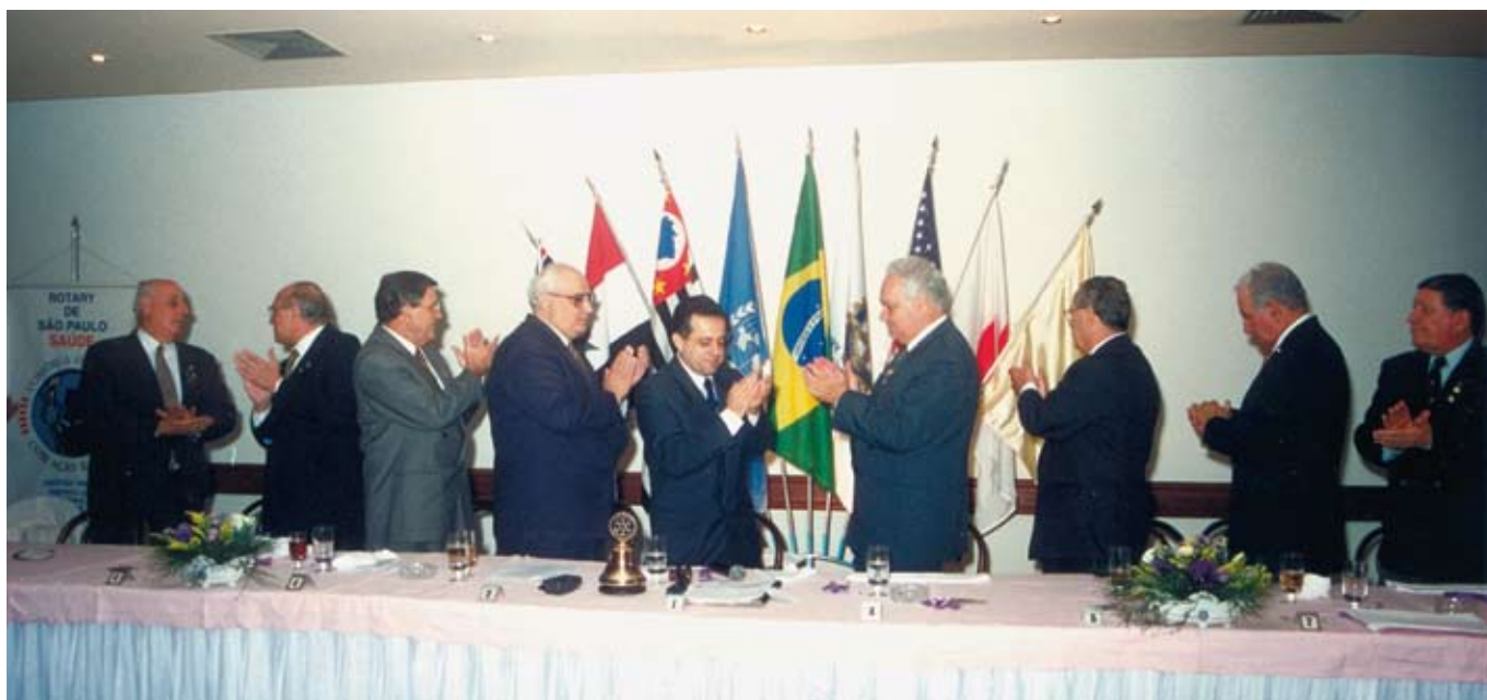
Posse da presidência do RC SP - Saúde, em 1995, com a presença de oito governadores na mesa diretora

Foram inúmeras as atividades rotárias em sua presidência, dentre elas destacam-se as ações de prevenção ao uso de drogas, reeducação alimentar e diagnóstico de hipertensão e diabetes, entre outras, além da fundação da ASFAR do clube. Terminada a gestão, dos doze troféus oferecidos para os melhores do ano, o RC Saúde levou cinco. "Até então, não posso dizer que o Rotary era uma prioridade em minha vida. Mas, a partir daquele ano, percebi que poderia me doar mais e que a instituição tinha muito mais potencial do que eu imaginava. Comecei a me dedicar integralmente. Estudei muito sobre Rotary. Entre as funções distritais, compondo comissões, passei a atuar também como selecionador de candidatos para Bolsas Educacionais e do Intercâmbio de Grupo de Estudos, que são segmentos da Fundação Rotária, um elo do Rotary que sempre me encantou. Assim, participei de todas as gestões do Distrito 4420", comenta o psicólogo.