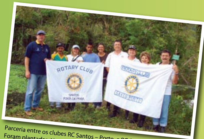
Parceria entre os clubes RC Santos – Porto e RC Santos – Ponta da Praia. Foram plantadas 41 mudas (Porto) e 22 mudas (Ponta da Praia), o número de sócios de cada clube