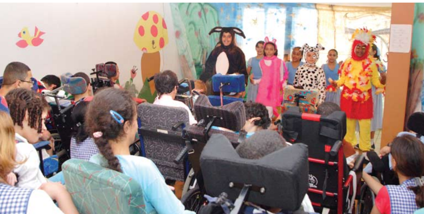
Alunos do Projeto Chama assistem à apresentação do espetáculo teatral Saltimbancos

O dia estava cinza. Um chuvisco intermitente insistia em molhar as ruas e os telhados do bairro Cidade Ademar, Zona Sul de São Paulo. Para muitos, a tarde daquela terça-feira estava mais para dormir. Dormir? Não para as crianças, jovens e adultos excepcionais do Projeto CHAMA, que estavam aguardando com uma ansiedade imensa a apresentação de alunos da Escola Estadual Valentim Gentil, que se preparavam para encenar o espetáculo teatral Saltimbancos. Quando os pequenos atores começaram a cantar “Bicharada”, a platéia, formada por 33 pessoas portadoras de deficiência (PPD), estava atenta a cada movimento. Era um dia especial para pessoas especiais. Os que encenavam estavam radiantes com a oportunidade de mostrar o que ensaiaram. Os espectadores não disseram o que sentiram, mas não precisava. Os olhares expressaram tudo.