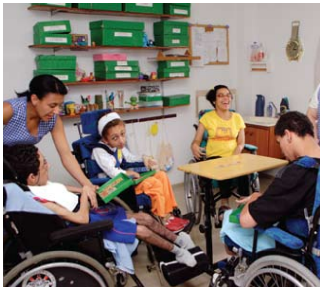
As salas de aula são divididas por estágio de reabilitação