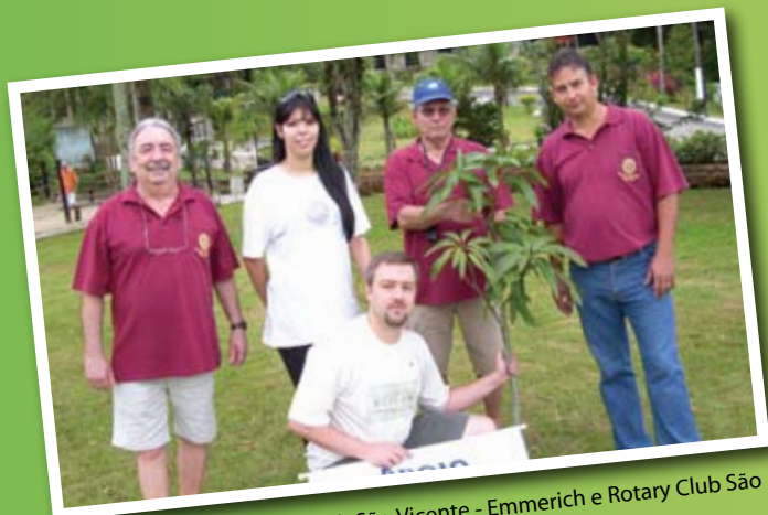
Dia do Plantio no Rotary Club São Vicente - Emmerich e Rotary Club São Vicente - Praia