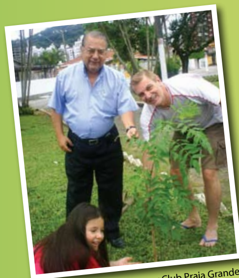
Plantio de árvores no Rotary Club Praia Grande