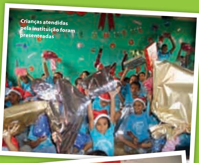
Crianças atendidas pela instituição foram presenteadas