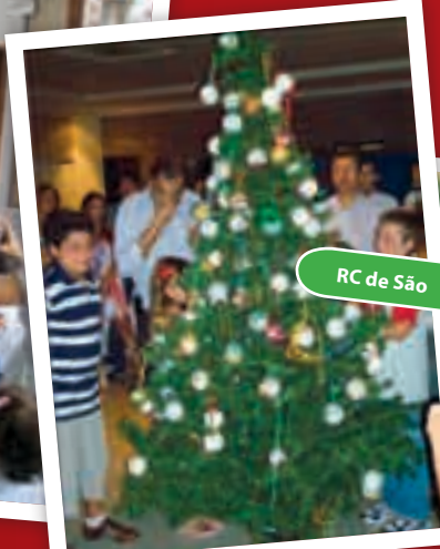
RC de São