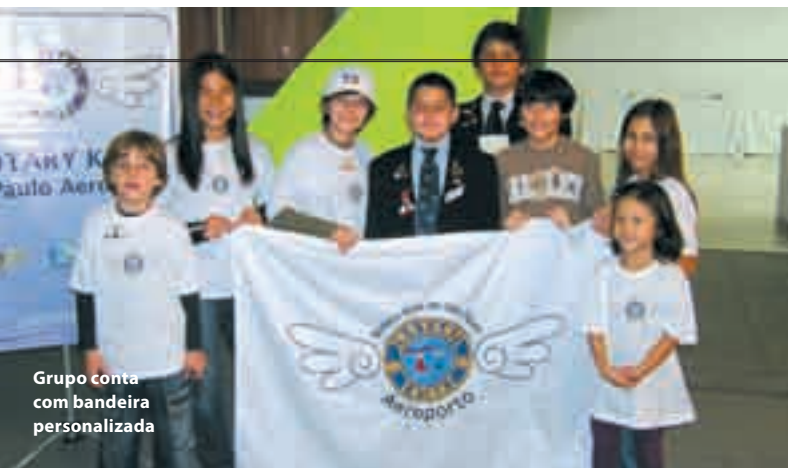
Grupo conta com bandeira personalizada