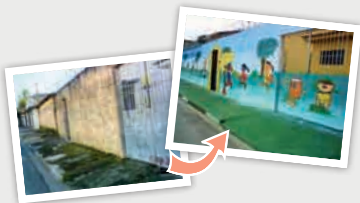
Instalações da creche João de Longe foram recuperadas e a entidade pode continuar em funcionamento