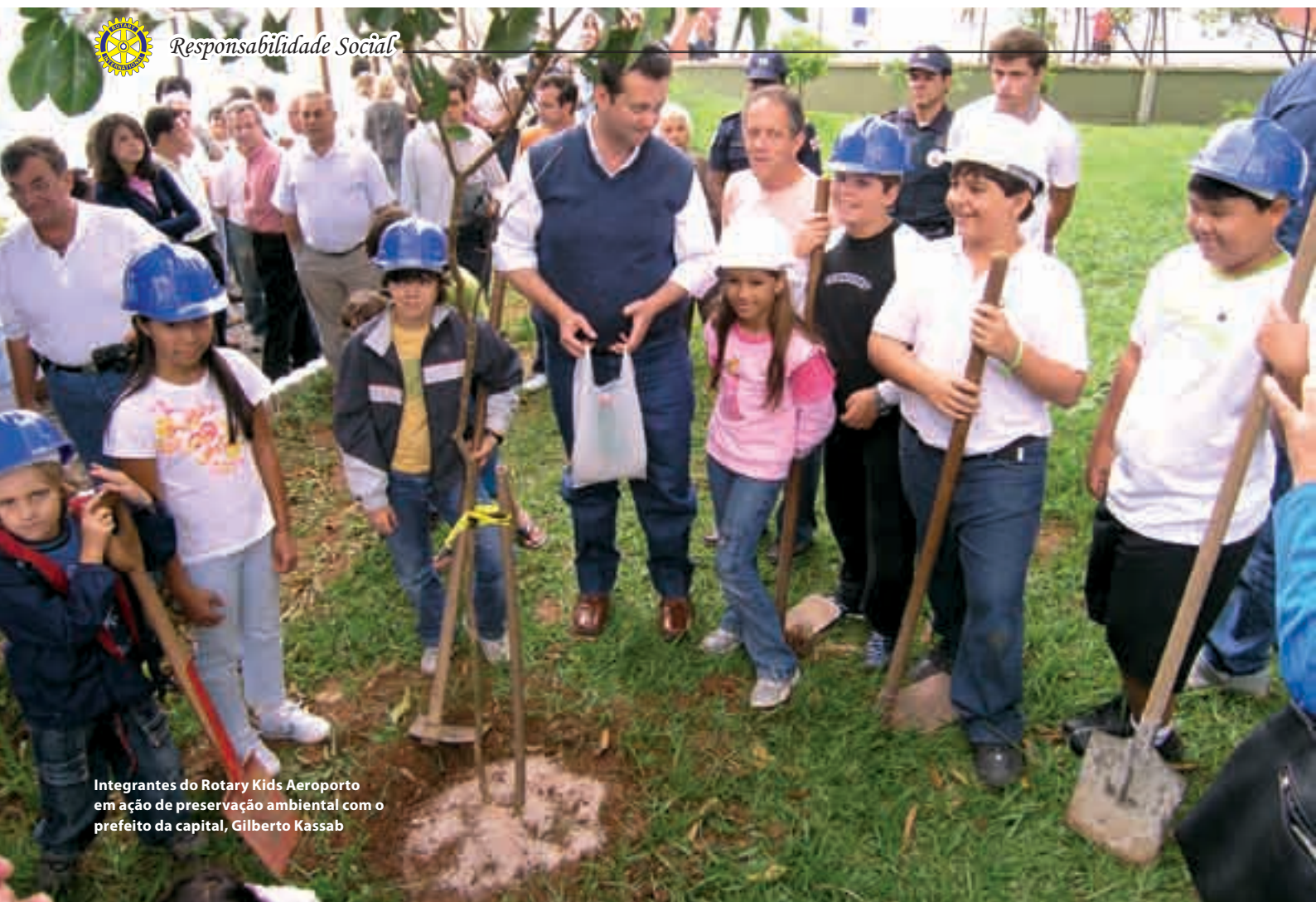
Integrantes do Rotary Kids Aeroporto em ação de preservação ambiental com o prefeito da capital, Gilberto Kassab