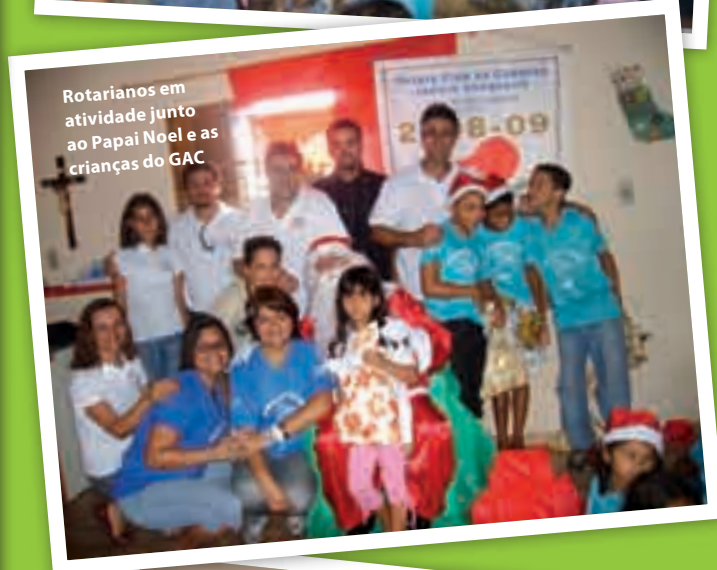
Rotarianos em atividade junto ao Papai Noel e as crianças do GAC