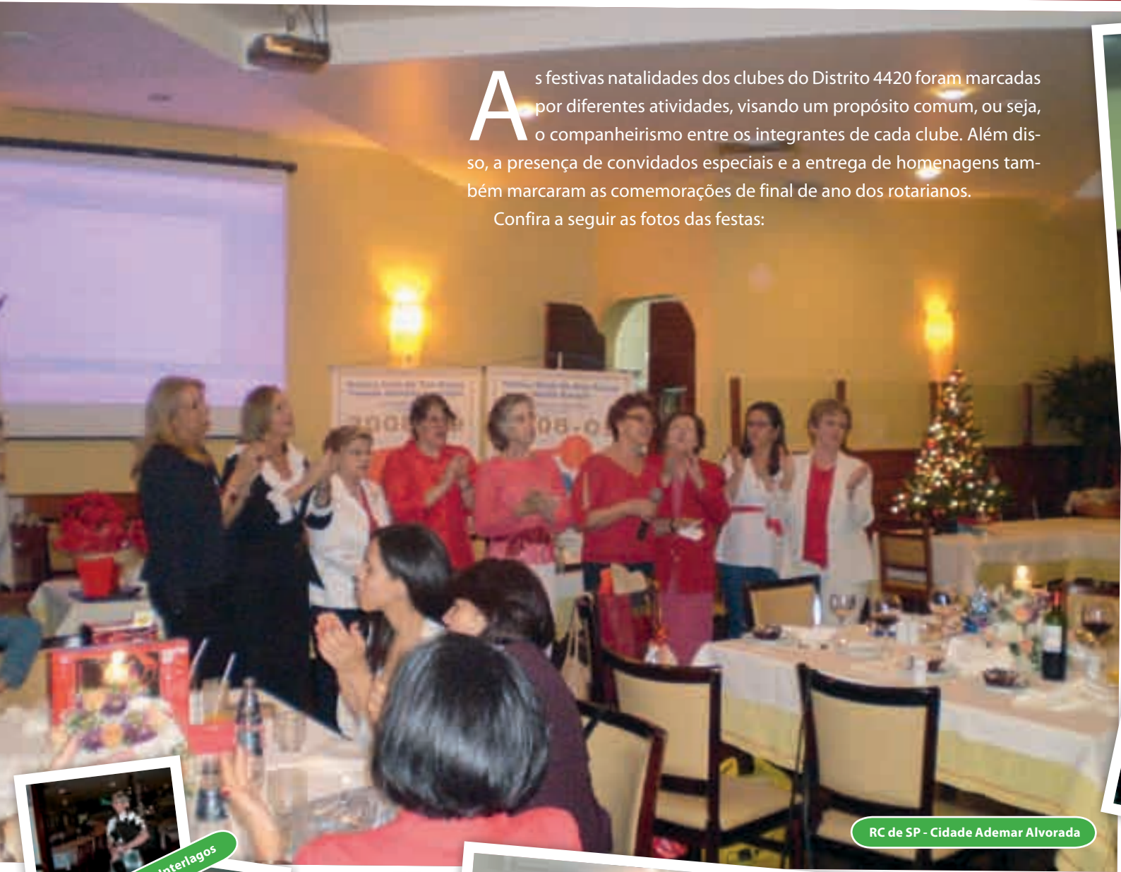
RC de SP - Cidade Ademar Alvorada