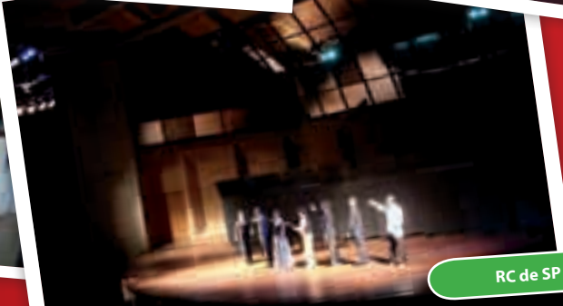
RC de SP - Santo Amaro