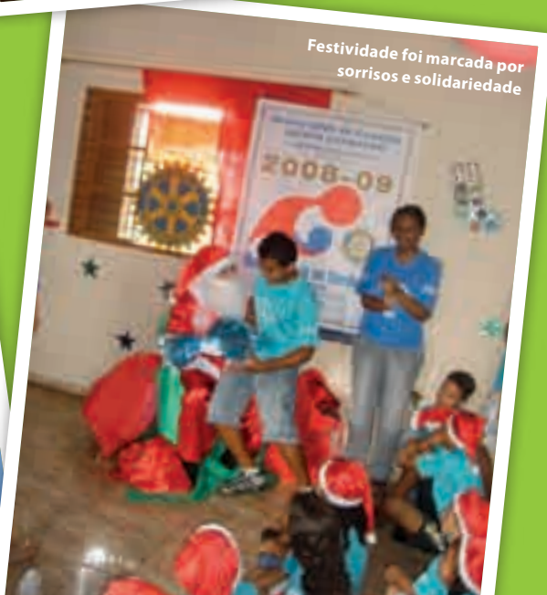
Festividade foi marcada por sorrisos e solidariedade