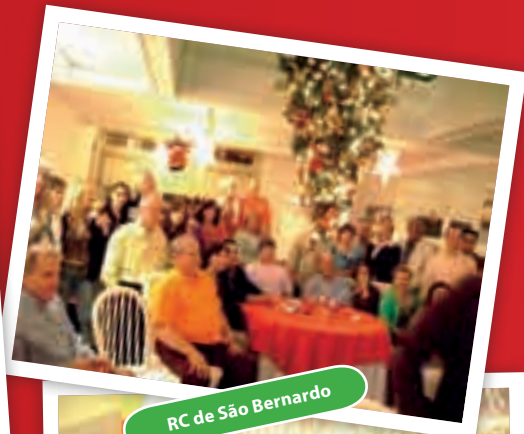
RC de São Bernardo