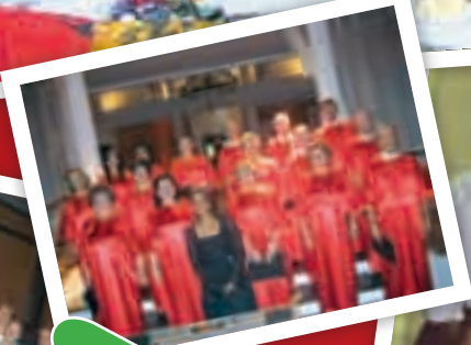
RC de Santo André