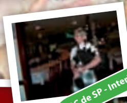
RC de SP - Interlagos