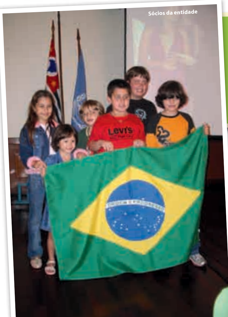
Sócios da entidade