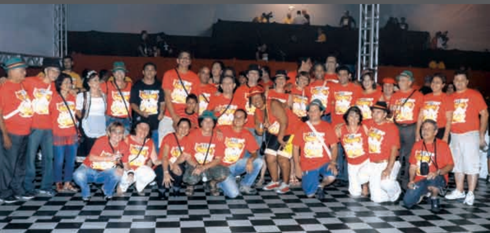
Rotarianos uniformizados durante a realização do evento

Consagrada como um evento de destaque na região, o Rotary Club de Cubatão comemora o sucesso da XVII Festa Alemã. Realizado dia 08 de novembro de 2008, o festejo integra o Calendário Oficial da cidade devido a sua importância cultural, turística e social.