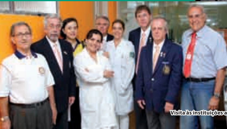
Visita às instituições amparadas pelo Rotary