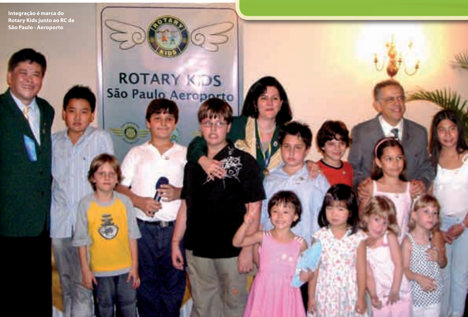
Integração é marca do Rotary Kids junto ao RC de São Paulo - Aeroporto