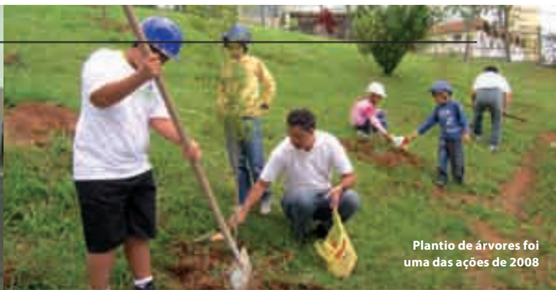
Plantio de árvores foi uma das ações de 2008