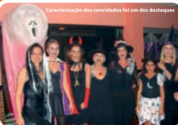
Caracterização dos convidados foi um dos destaques