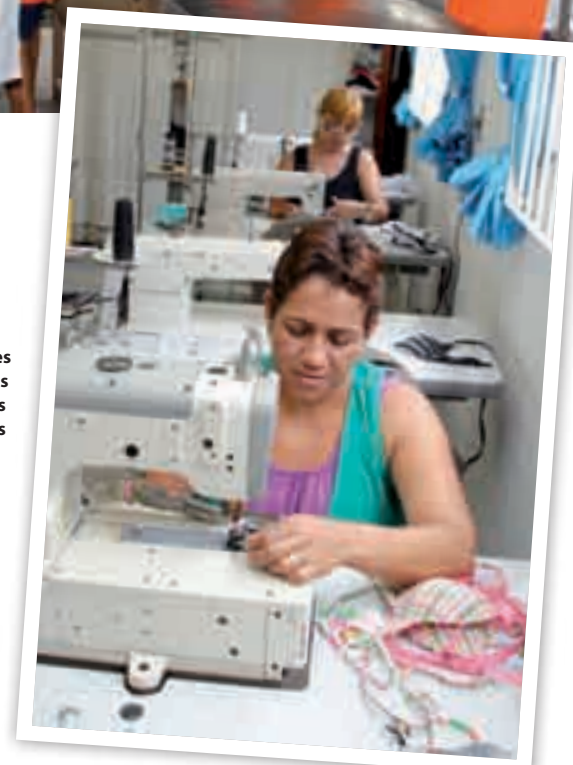
Instalações das entidades amparadas pelos rotarianos