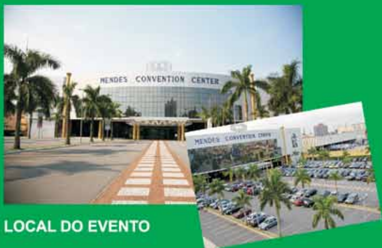
LOCAL DO EVENTO

FAÇA HOJE MESMO SUA INSCRIÇÃO PELO SITE: