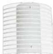
Aranha - Ustres Brancas - para 1 lâmpada Ref. AP678/1 Medidas: 260 x 235 x 90 mm