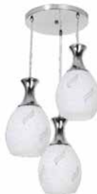
Para 3 Lâmpadas Ref. 288/3