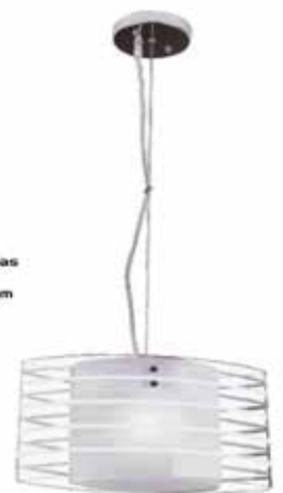
ente - Ustres Brancas - para 1 lâmpada PD5109/1 das: 325 x 120 x 900 mm