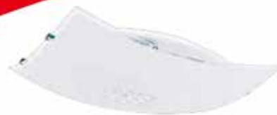
Plafon - para 2 lâmpadas Ref. PL3004/2 M did 300 x 300 mm