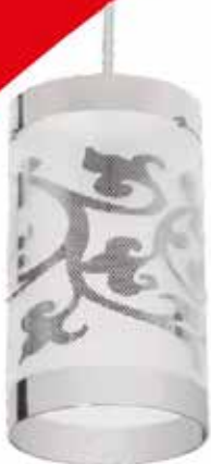
SANANTA. Produto garantido por 90 dias, contra defeitos de fabricação a partir da data de emissão do nota fiscal de compra. Não se aplica a produtos de decoração. Produto não projetado.