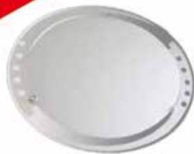
Plafon - para 2 lâmpadas Ref. PL3965/2 Medidas: 315 x 315 mm