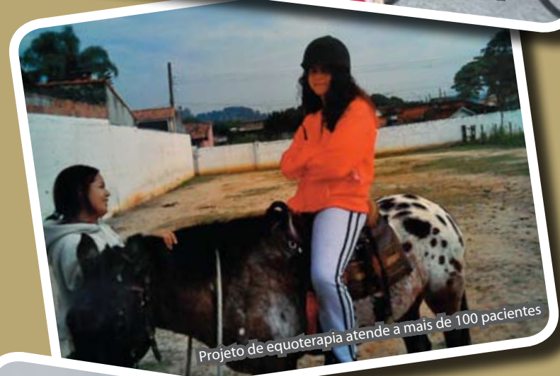
Projeto de equoterapia atende a mais de 100 pacientes