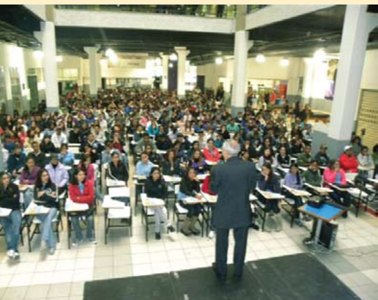
Dr. Ozires Silva, Ex-ministro de infra-estrutura e Reitor da Unimonte falando ao público.

No dia 16 de junho, o Rotary Club de Santos em parceria com a Diretoria de Ensino – Região de Santos realizou o Projeto Rumo, de orientação profissional destinado aos alunos do 3º ano do Ensino Médio Estadual com o objetivo de fornecer informações sobre determinadas profissões, mercado de trabalho e suas oportunidades.