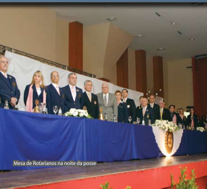
Mesa de Rotarianos na noite da posse