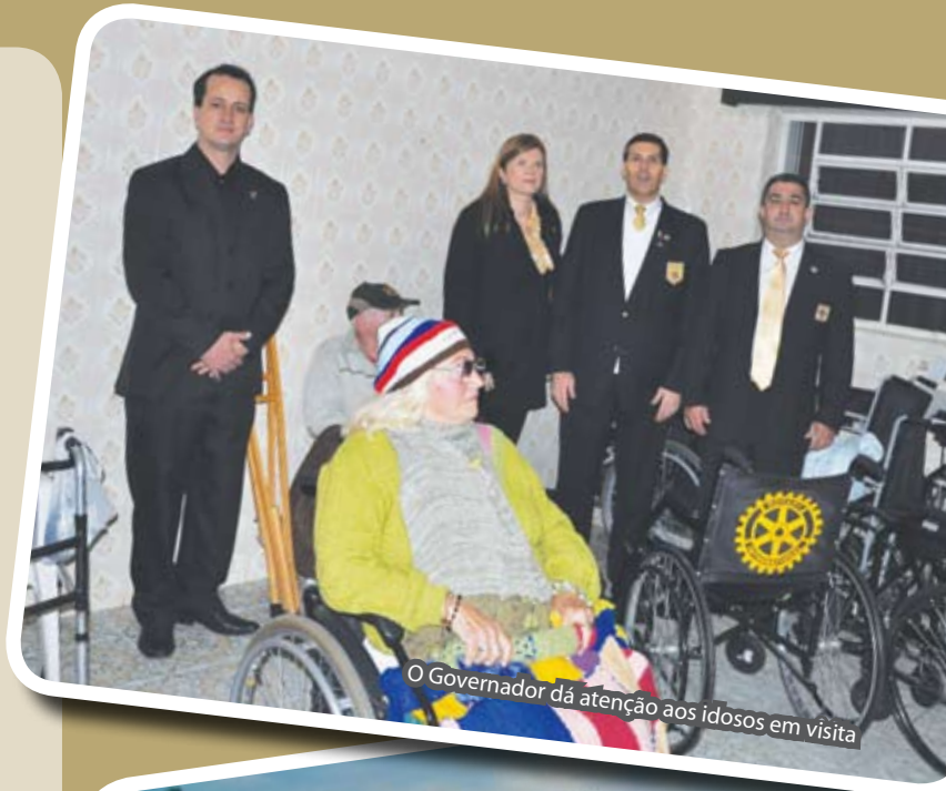
O Governador dá atenção aos idosos em visita

O clube local pretende colaborar para que sejam feitas melhorias na parte estrutural da casa e na aquisição de equipamentos adequados para a cozinha e lavanderia.