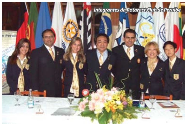
Integrantes da Rotaract Club de Perúibe

O Rotary Club de Perúibe , torna-se agora o 1o club do Distrito com toda a "família rotaria" completa, ou seja, Rotary Kids, Interact, Rotaract e Casa da Amizade.