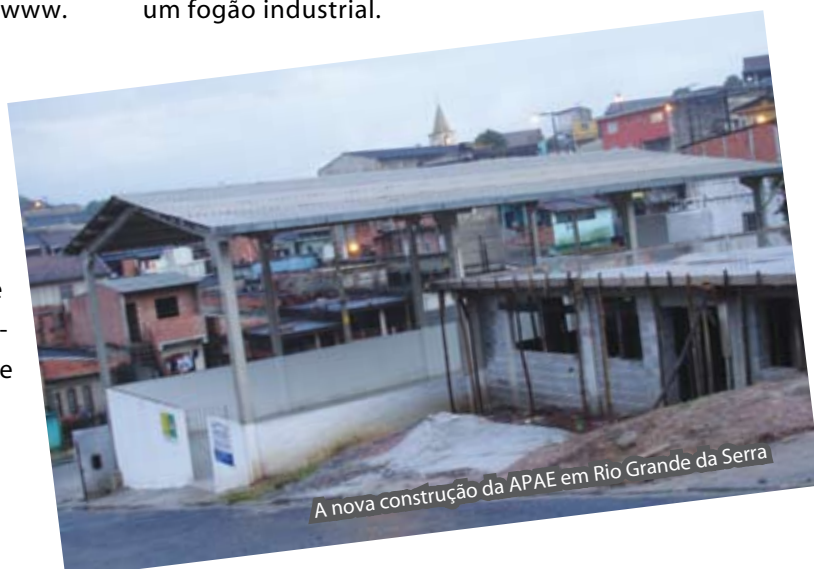
A nova construção da APAE em Rio Grande da Serra

A APAE existe no município há 18 anos e atende cerca de 100 crianças com comprometimento intelectual e motor. Atualmente, com a colaboração dos companheiros do RC Rio Grande da Serra, está sendo construído um novo prédio, que abrigará a oficina de reciclagem. Além deste novo projeto, o clube local e o de Ribeirão Pires colaboraram, entre outras ações, para a montagem do refeitório, com a doação de mesas e de um fogão industrial.