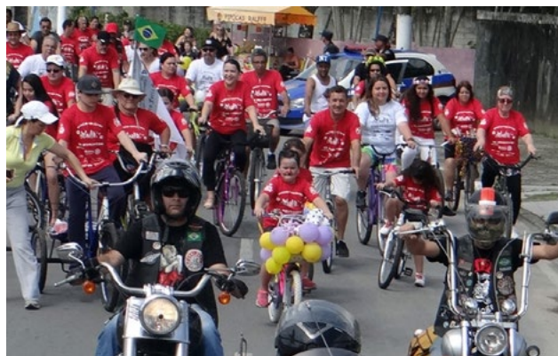
Moto Clube Canídeos, Cowboys da Praia e Bodes do Asfalto marcaram presença no evento