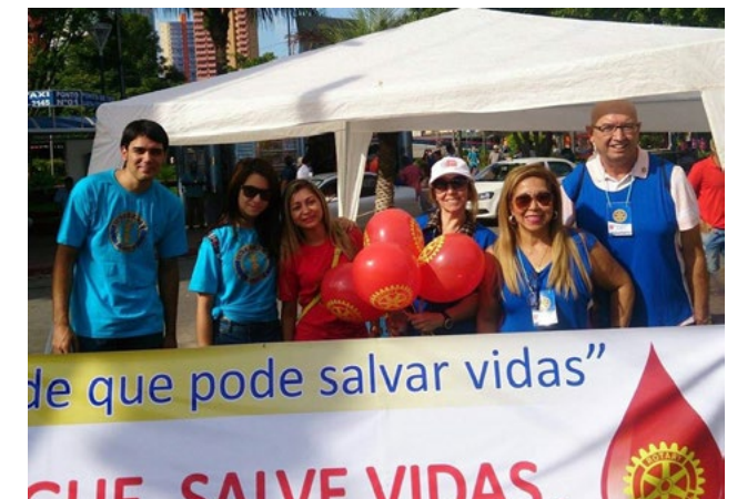
Em parceria com outras entidades, os interactianos participam de campanhas pela doação de sangue