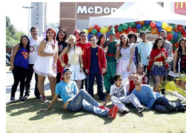
Durante o Mc Dia Feliz, os jovens do Interact Club de Mauá colocam em prática suas ações