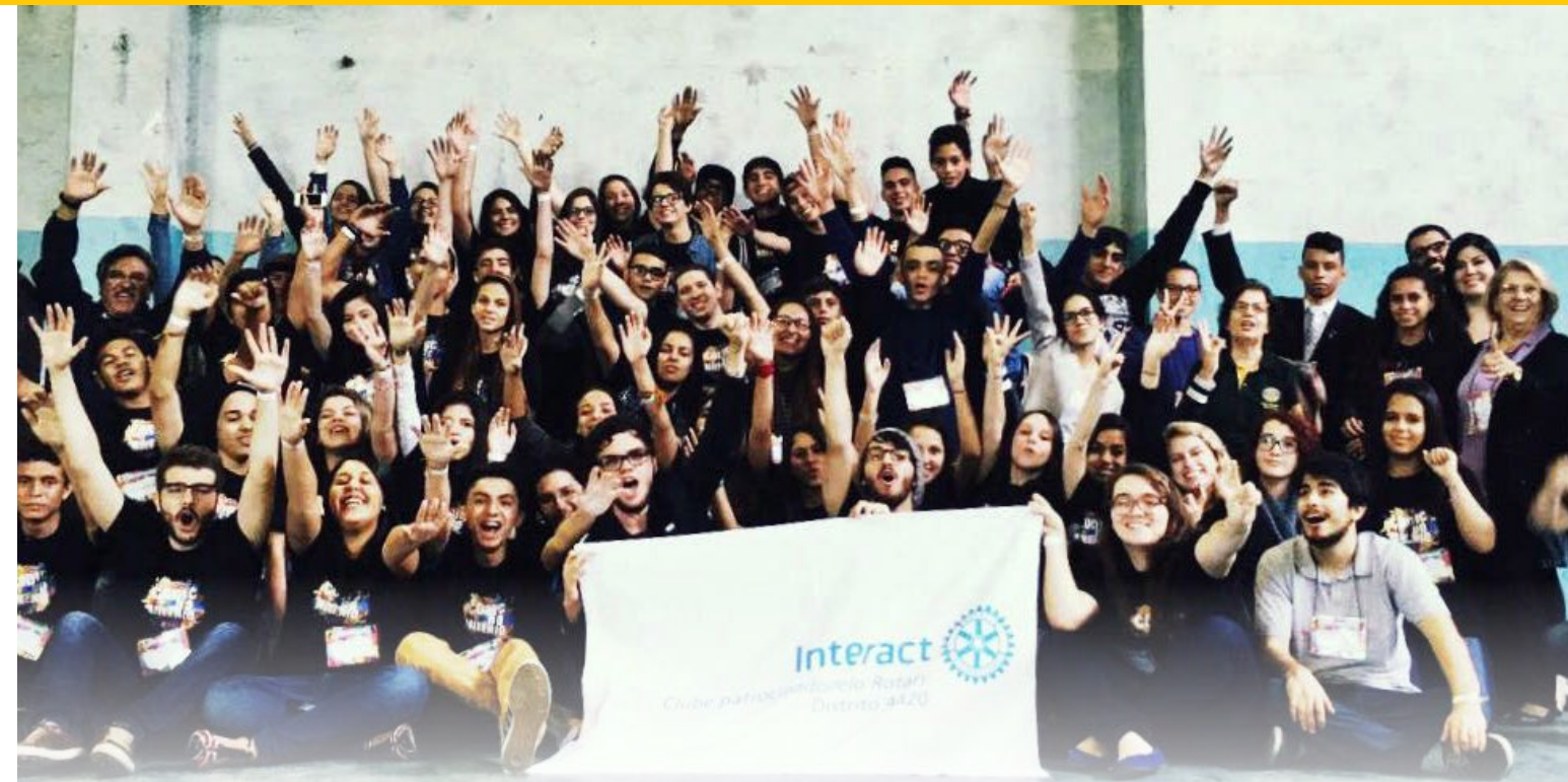
O Interact 4420 sempre marca representatividade em eventos multidistritais