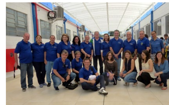
Equipe do YEP 4420 contou com a ajuda de rotarianos, educadores e psicólogos voluntários