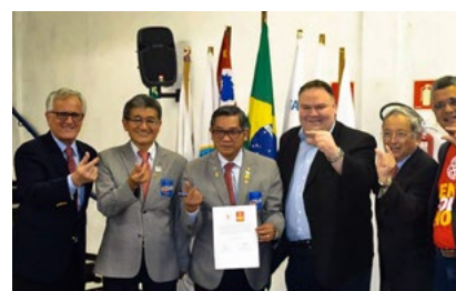
Representantes do Distrito 4420, da SBI e médicos infectologistas celebram o acordo

No caso do Brasil, a doença foi erradicada em 1989, mas o compromisso de continuar vacinando os pequenos não pode parar. Ele reforça que a importância desta luta em outros lugares do mundo não é apenas dos rotarianos, mas de toda a comunidade global. “Temos responsabilidades com as crianças do planeta. Agora, em especial, as nigerianas, afegãs e paquistanesas necessitam mais do que nunca da nossa ajuda. Para garantirmos um mundo melhor, temos que estar a serviço da humanidade. Como especialistas em doenças deste tipo, temos que trabalhar até o fim da poliomielite. Parabenizo todos que ajudaram nesta parceria entre o Distrito 4420 e a SBI”, conclui o infectologista.