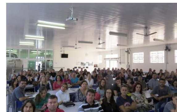
Pais e responsáveis receberam dicas e orientações sobre o amplo processo de intercâmbio