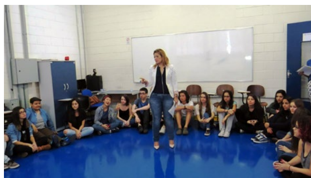
Facilitadores realizaram várias dinâmicas com os jovens durante o processo classificatório

No segundo dia dos trabalhos, as entrevistas da manhã foram realizadas com pais e jovens residentes no ABCD Paulista. Na parte da tarde, foi a vez daqueles que moram na cidade de São Paulo/SP. Após a apuração dos pontos obtidos pelos candidatos nas provas escritas, dinâmicas psicológicas e entrevistas, incluindo as avaliações com pais e responsáveis, será elaborada uma lista classificatória pela Comissão do YEP. Os jovens que conseguirem as maiores notas ficarão em uma relação de ordem decrescente. Ela será utilizada na próxima etapa do programa, onde os jovens farão a escolha dos países de suas preferências, respeitando as pontuações obtidas em todo o processo classificatório.