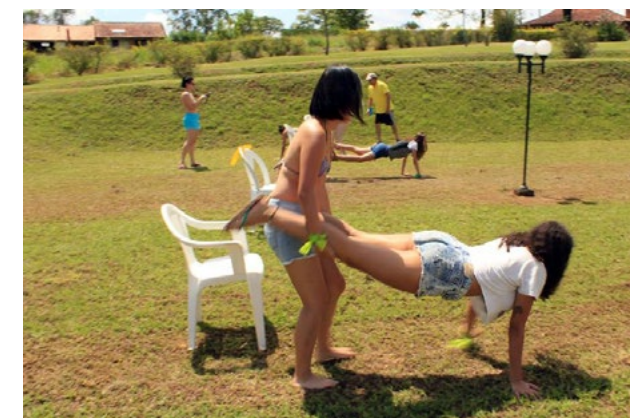
Além do espírito de competição, interactiadas movimentou a galera com muita integração