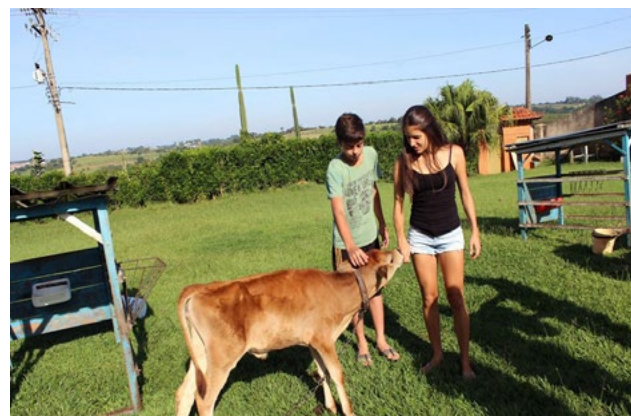
Contato com os animais da roça e o meio ambiente também fizeram parte da programação do ENDIC