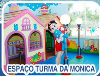
ESPAÇO TURMA DA MONICA

Para mais informações e inscrições, acesse: