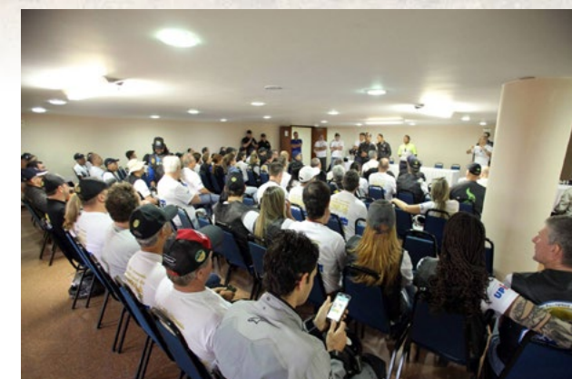
Dicas e orientações também fazem parte do roteiro dos motociclistas durante os eventos