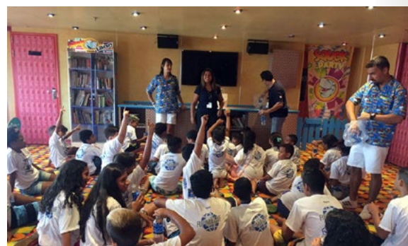
Recreação e interatividade também fizeram parte da animada visita ao Costa Fascinosa

2 - O Rotary Club ou a empresa devem emitir os boletos no endereço eletrônico www.abtrf.org.br/contribua para que a empresa possa cumprir com tal compromisso. Nesse link é possível gerar vários boletos de uma única vez, de modo que a empresa já pode deixar agendado o envio de todas as suas contribuições. Apoie o programa e ajude a financiar os projetos da Fundação Rotária no Brasil.