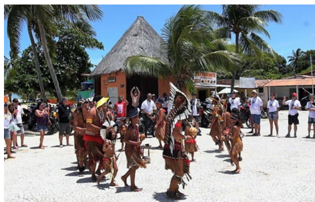
No litoral da Bahia, eles foram recebidos pelos índios que vivem lá desde o Brasil colonial