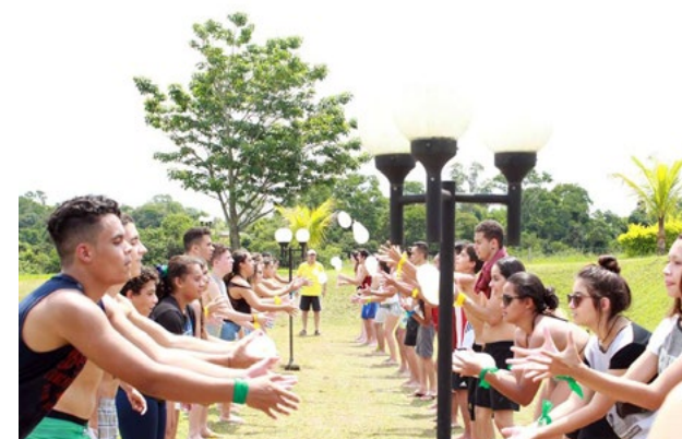
Atividades ao ar livre promoveram o espírito de liberdade dos jovens participantes