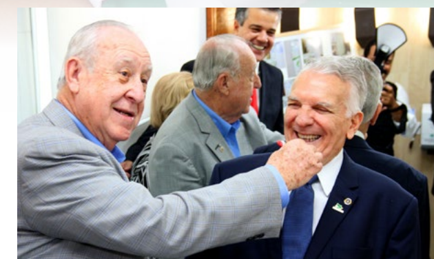
Descontração total no escovódromo da Casa da Esperança