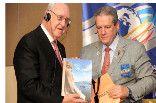
Livro de 90 anos do Rotary Club de Santos foi entregue ao Presidente Germ