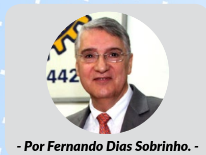
- Por Fernando Dias Sobrinho. -

Associação ao Rotary: Os clubes podem determinar suas próprias regras quanto a rotarianos que estiverem mudando de clube, dupla associação e associados honorários. A dupla associação pode continuar, entretanto, o associado será reportado ao Rotary como pertencendo a somente um clube. Se preferirem, os clubes têm a liberdade de continuar seguindo os dispositivos tradicionais para seus associados. As únicas qualificações obrigatórias para associação são as seguintes: os rotarianos devem ser adultos que demonstrem caráter ílibado, integridade e habilidades de liderança; possuam boa reputação em sua área de negócios, profissão e comunidade; e sejam capazes de trabalhar pelo bem de suas comunidades ou de outros lugares do mundo.