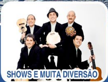
SHOWS E MUITA DIVERSÃO