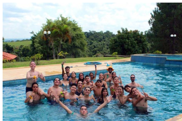
Fim de semana de sol e calor presenteou o encontro com piscina e descontração