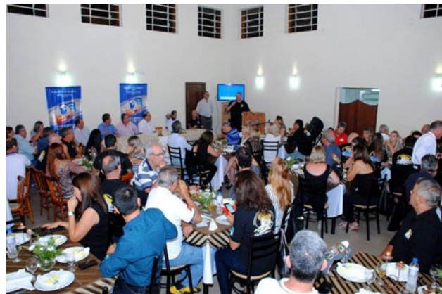
Companheirismo também é marca registrada em todos os encontros promovidos pelo IFMR-SA