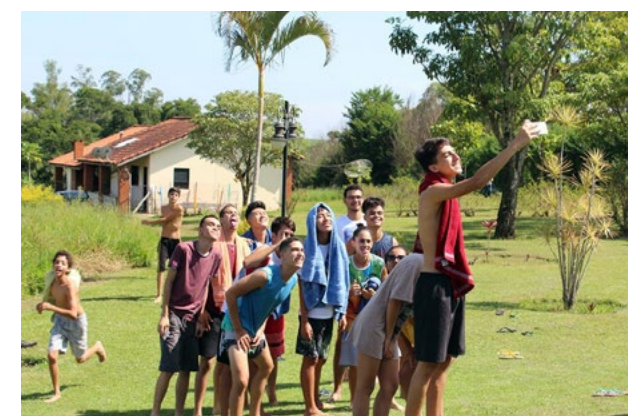
Os jovens exploraram toda a liberdade oferecida pelo sítio "Mamuska", em Capela do Alto/SP