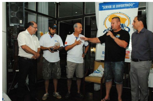
Reconhecimentos e protocolos rotários são mantidos durante as cerimônias oficiais do grupo