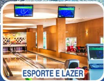
ESPORTE E LAZER