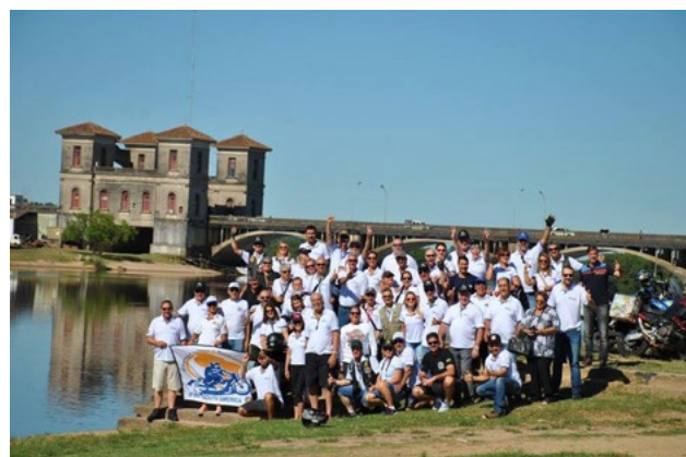
Passeio em Jaguarão/RS, na divisa com o Uruguai, foi realizado recentemente com total sucesso