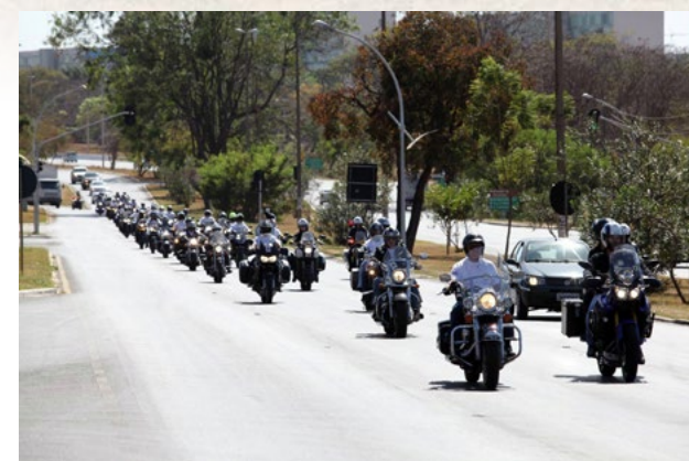
União e disciplina fazem parte dos comboios que cortam as estradas pela América do Sul